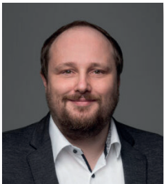
Andreas Kraut Center Integrated Business Applications